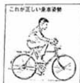
これが正しい乗車姿勢

自転車は、ただ乗ってペダルを踏めばよい、というものではありません。安全で、しかも楽しく乗るためには次のことに注意して、正しい乗り方をしなければなりません。