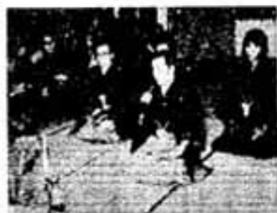
新郎に挨拶する花婿代表ら

酒だるを、神前に供えて神宮のおはらいを受けます。この神を奉おうと神の若衆が境内の神池で練りひろげる行事がクライマックスで、いくつにも割られた神片は、それぞれ持ち帰って神棚に供え、開運を祈ります。