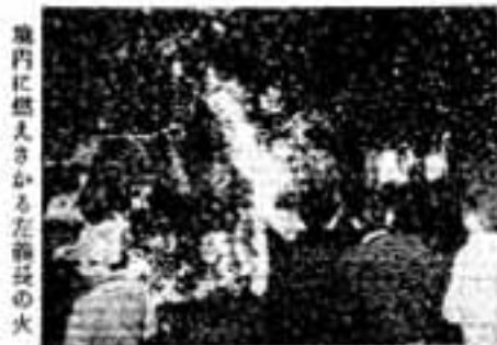
つがひの唄から若い者い合を焼

婿押（たるせり） 概元（青年団長）は宿の床の間に控えて、親の子ども衆から青年たちが守った