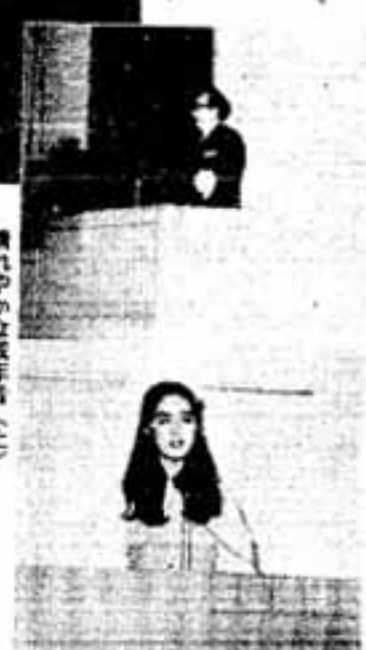
晴れやかな成年者(上)