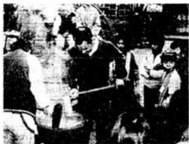
こどものモチつきを助ける大人たち