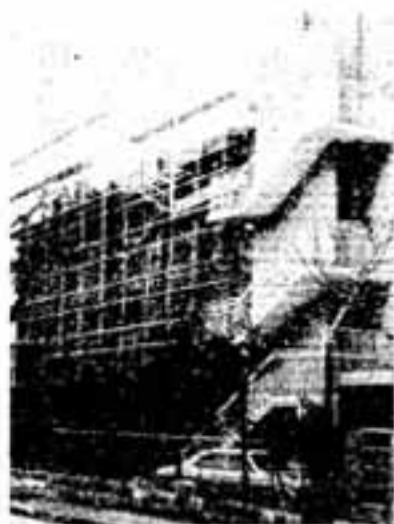
(写真) ●春日小学校 ●春日西小 学校の増築工事 ●工事完了の春日東中 学校 (右側の3教室)

春日市の小、中学校児童生徒の増加よりは少しも衰えず、こ としも市は学校の増築に追われています。