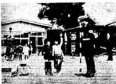
児童の交通安全教室

これらは親を含む大人のしつけ、指導の不足などにある、として築紫野署では、子どもやおとしよりを特に監