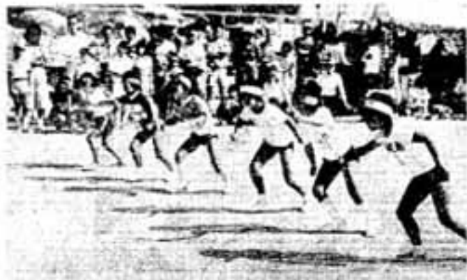
地区の期待を小さな足にかけて (育成会対抗リレー)