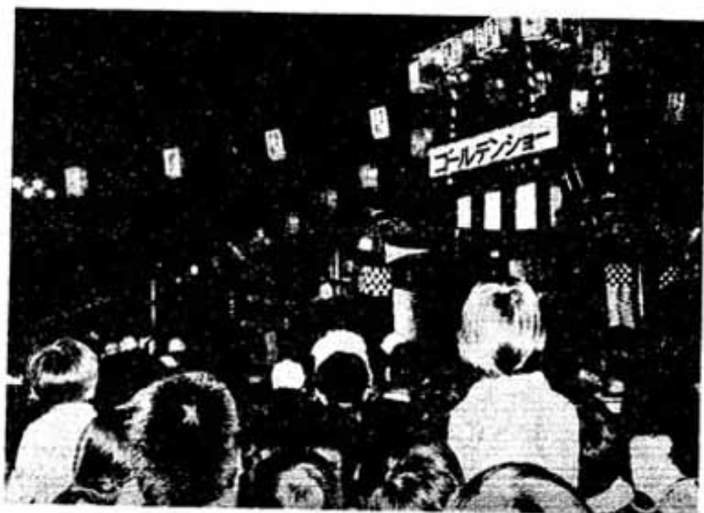
屋外ステージを機軸にも進む踊りの輪・人の波