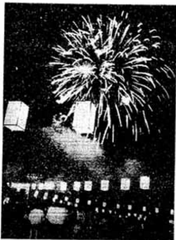
暗夜を染める5色の火 若い母子づれに最も人気があったのはこの花火大会でした。