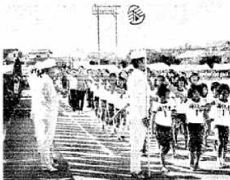
大会の冒頭をかざる入場行進 (本部席に挙手礼する須玖選手団)