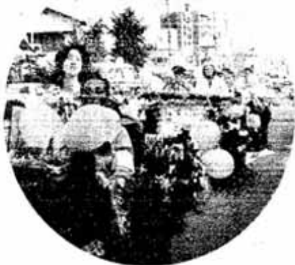
花やかなミスパレード