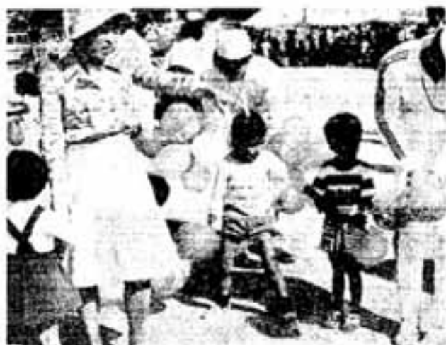
幼児の風船取り 懸命なのはお母さん