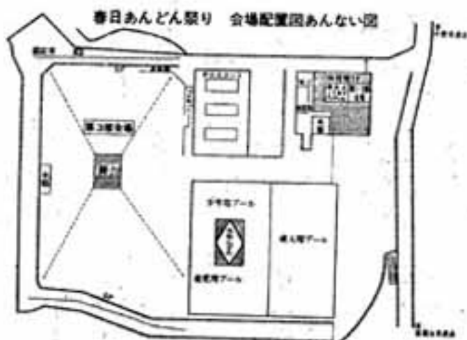
ずんどうあんどん

第六回春日市民体育大会は、10月10日(月)午前9時から春日市立市民スポーツセンターで行われます。なお、今年の市民体育大会は市制5周年記念行事の一環として行われます。 市民体育大会は10月10日に 実施種目はリレー競走を主にした陸上競技で、当日、雨天のさいは予備日の同16日(日)に実施いたします。 で、市民多数のご参加をお願いいたします。 (社会体育課)