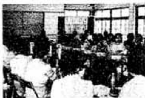
商工婦人部と市消費者の会の懇談会が8月23日、商工会会議室で開かれました。