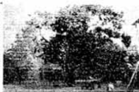
春日小学校のエンジュ

同神社拝殿の北側にあり、玉垣で囲まれた3辺30×1辺70の長方形、厚み30cmの大石です。現在の場所におさまるまでに3回ほど移動したらしく、明治23年ごろ近くの民家の建築の妨げになり除けられました。 大石の下にあったカメ槍の内外から銅矛・銅剣・玉類・中国で作られた銅鏡30面などが出土し、宝物類の数と内容から推して当時の「奴の国王」の墓だという学者もあり、漢式鏡の残部は収蔵庫に保管されています。