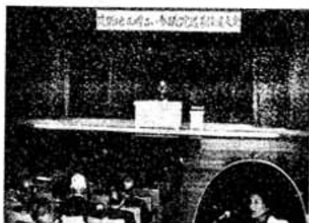
「明るく、きれいな選挙の実現」「有権者の投票総参加」を目標に掲げ、筑紫地区明るい選挙推進大会が去る5月18日大野城市中央公民館で行われました。