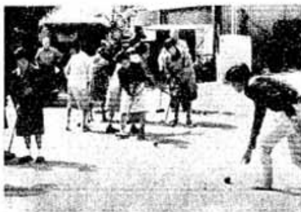
ゲートとバットの先を、じっとにらんで(須玖公民館広場で)

いかがです ゲート・ボール 「わぁ、はいたー」「ウーン」 なかなかむずかしいナ…… 風さわやかな、去る5月17日、須玖公民館前の広場で、老人クラブのみなさん36人がゲート・ボールを楽しみました。 これは若社会体管理が今年から新しく老人向けのスポーツ種目として取りあげたもので、第一回は須玖老人クラブの要請により同地区で実施されました。はじめで皆さんに大変喜んでもらえたようです。反響を見て今後各地区でもつぎつぎ実施していきます」と社会体管理もはりきっています。