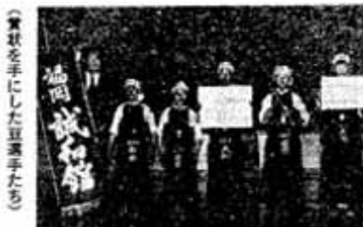
(賞状を手にした選手たち)