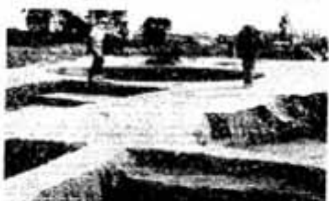
大谷遺跡の住居跡発掘現場

うかと考えるのも楽しいものです。 住居跡の周辺には、食物を蓄えるため まはも地中に掘り下げている貯蔵穴があ ります。 住居跡や柱穴はどのようにして発見す るのでしょうか。ここで説明いたしまし よう。まず発掘地の表土を削って、土の 色がちがった部分を見つけ、その通りに 掘を引きます。この線の内側を移植して で外に向けて少しずつ掘ると、あとで埋 まった土だけとれ、かべ(壁)が出て明 らかになります。発掘する人が勝手に掘 っているのはありま せん。