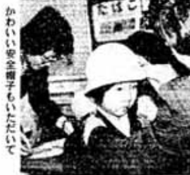
かわいい安全帽子もいたいて

く1時間前からです。なお、春日西中学校の開校式は4月7日午前9時から行われます。