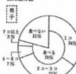
1週間に食べたインスタントめん類の数

その結果、栄養のバランスやおふろの味といったものまで家庭料理から遠のき、食べものを中心とした親子の愛情までも変ってきたのではないのでしょうか。(春日市消費者の会)