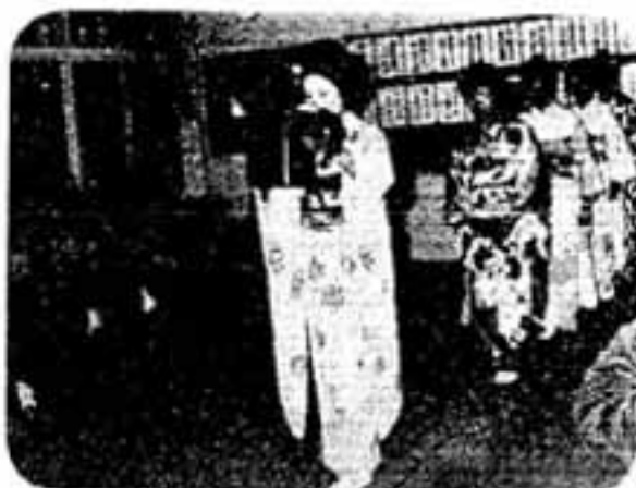
写真② 部長長や地区の先輩たちのお祝いを受ける、もう責任ある社会人になる