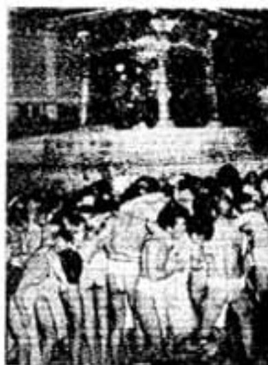
贈り物を受けます。花婿代表が「よろしくご指導を……」とあいさつ、続いて花嫁の親身(のし)出し。行事最後の贈りに移りますが、この祭は、数百年の歴史をもち、県の無形文化財にも指定されています。