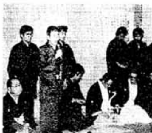
新郎には手荒い贈り物 まず新婿、新婦は宿で、主催者の三浦組合代表・氏子総代会長のあいさつ、庶務長の祝

新婿の氏子夫婦を祝福する春日神社の婿押し祭は、今年も1月14日夜、盛大に行われましたが、新郎には社会人としての門出に贈られる“手荒いプレゼント”です。