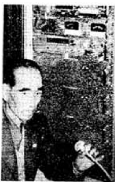
活躍する千歳町放送局

地域活動のお手伝いに「コミュニティ」コーナーを設けました。コミュニティは「地域社会」とも訳します。 朝夕、お互いに顔が合っても、隣人との間に挨拶もないギスギスした昨今、趣味やレクリエーションを通じ、その他の関わりでグループや仲間をつくる地域活動が春日市でも盛んです。楽しい小社会、を大きくし、住みよい社会にしようというわけです。各地区や公民館、その他の活動・ニュースをお知らせください。このコーナーでご紹介します。でんわ501-1131 市長公室(内線77・83)