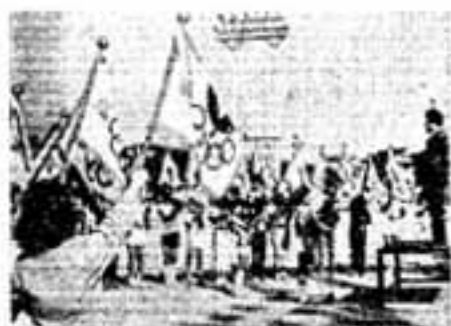
開会式の選手宣誓

以下男勝部) 空手道チーム(一般女 開けリレー) 春日台チーム(一般男 開けリレー)