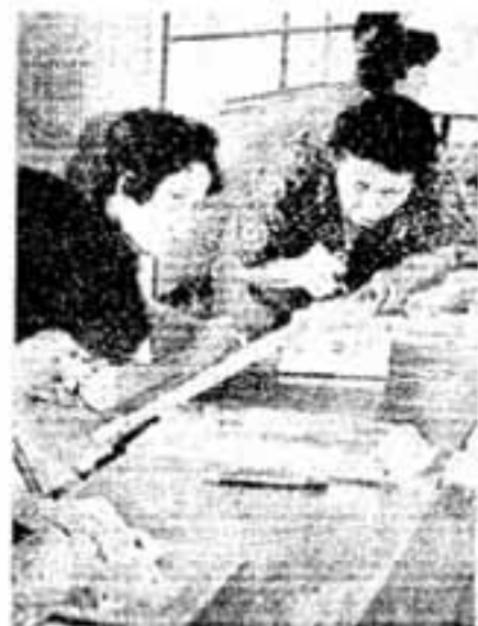
出品作の仕上げに取り組む 「木彫教室」のみなさん