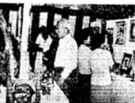
第3回千歳町文化祭

ポンプ操法で東分団総合優勝 第8回春日市消防団ポンプ操法大会が9月10日春日原小で行われ東分団が総合優勝しました。また市が購入したポンプ自動車一台が引き渡されて戦力に加わりました。