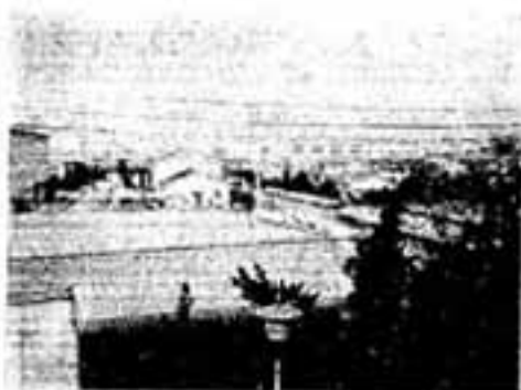
昔は沖集落があった自衛隊基地

新築駅(現在の南福岡駅)の西側に建設されると、この水田地帯の権利が一変してきました。日華事案の進展と共に「九段」も拡大の一途をたどり、昭和十五年七月には、伸、野原方面に進出するため同本山東方の野原の丘を削り、四十ヘクタール