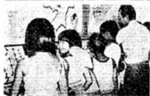
昆虫展会場にぎわう

「下で」「空き巣わら」と「自転車どろぼろ」が依然として多発していますので、10月11日から20日まで実施される全国防犯運動で警察・防犯協会、あき巣わらいと自転車どろぼろの防止に重点を置き「ドアには必ずロックを」「自転車には防犯シールをはる」運動を中心にした防犯活動を展開します。 なお、防犯シールは、自転車どろぼろの犯行に心理的なブレーキをかけ、盗まれた場合も早く発見されやすく、またシールはスコッチテープが使われていますので、夜間の交通事故防止にも効果があります。 防犯シールは警察署内の防犯協会であっせんしています。