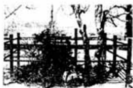
風通天神(上白水公民館前)

上白水に「七天神」というところがあります。筑前松風土記拾遺に「村内三ヶ所に天神有、その内五社は毎年十一月十五日村民集いて祭をなす」とあり、また、松風土記附録には天神七祀として、その所在が記されています。キクヤ