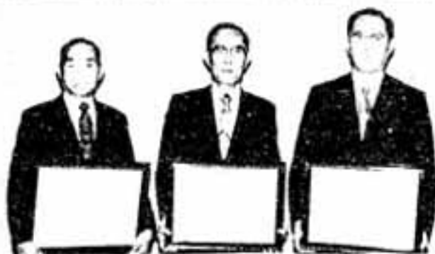
永年勤続議員の表彰式が6月21日、市議会議場で行われ、亀谷市長