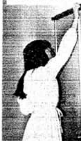
店開きした実行委事務局

が、祭りの期日は8月19日(土)20日(日)の二日間とし、昨年以上に祭りのよん田気を盛り上げる意気込みで、ミス春日の選影などが行事の中心テーマに落ちることになりそうです。