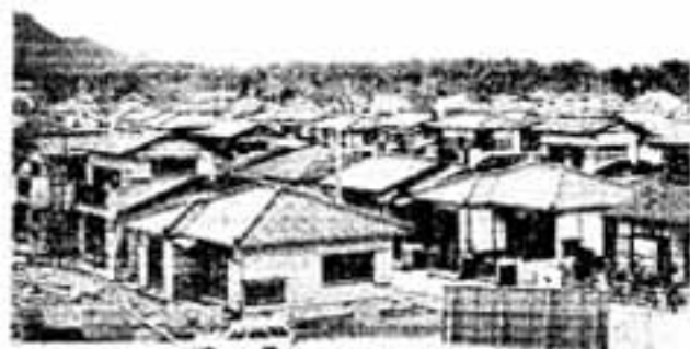
白水池を生かし「公園のあるまち」を一はりきる地元

発された旧南春日台団地で、昨年8月、県の告示により「松ヶ丘」の町名で、わたしたちの町づくりに踏み出しました。その後、当時の84世帯は10月も