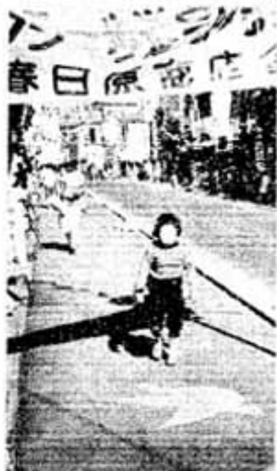
春日原商店街の一角と春日小学校正門前の歩道がきれいにカラー舗装されました。ウグイス色の地にキリン・ラクダなどの動物や鳥・花・時計などカラー舗装に(花)や鳥を赤・黄・白色で塗り込み、子ども達も大喜び。商店街では「折角のカラー舗装ですから」と店の前を掃き掃除で拭く風習も見受けられます。(写真は春日版で)