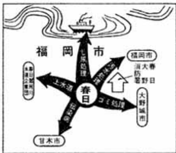
春日市と各市町の機能分担の現況