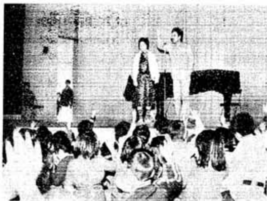
熱心なゲーム指導に講堂を埋めた児童も笑い一色に（春日小学校で）

老人クラブや子ども会などの集いに喜びと笑いのタネをまき続け、おとしよりや子どもたちから、感謝と拍手で迎えられているグループがあります。中央公民館の社会教育学級「レクリエーション愛好会」がそれです。