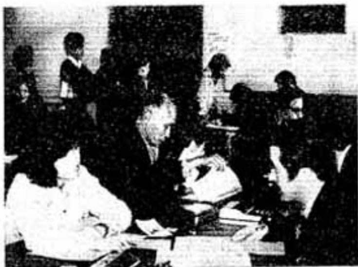
昨年の受け付け風景 (中央公民館会場)