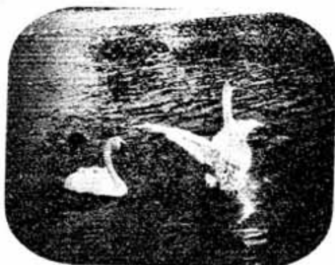
「ここもキレイだノ」とはしゃぐハクテョウ

水の踊り子、初登場 白水池に白鳥4羽 旧冬12月26日、二つがい4羽のハクテョウが新日鉄八幡製鉄所から贈られて来ましたので、市では白水池に放ちました。 市職員の手で指かれたハクテョウはこれまで任んでいた歌郷の北九州とは環境のちがった白水池を見て少し興奮をみ、しかし、池に放たれると、おだやかな足どりやで優雅な姿を水面に浮かべて、いかにも「白水池のハ