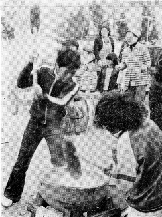
モチつきにガンばる子どもたち㊦ モチもみ部隊で身動きできぬ公民館内㊦