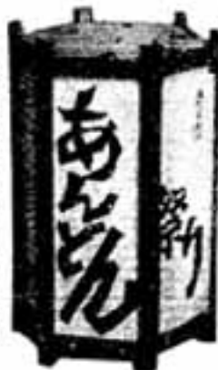
市民まつりのシンボルあんどん