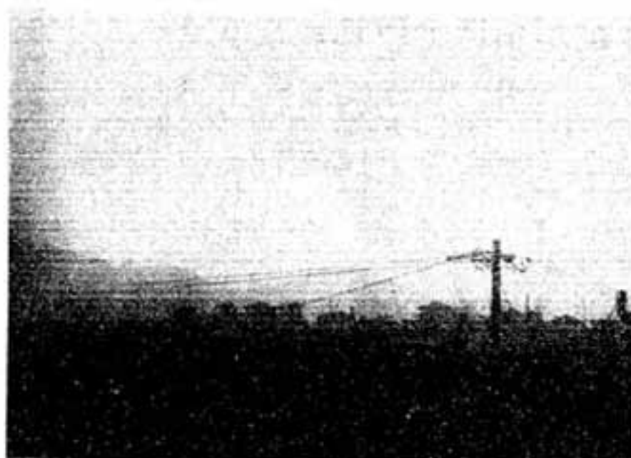
家並みと電柱がなければ、古筑前の日拝風景もしのばれる (左の峰は宝満山、電柱の手前は日拝塚の墳丘)

「日拝塚」の地名は、國塚墳丘下の宝満山から発見された副都府品から推して、約1300年前の古墳時代にこの地に住んでいたと思われる豪族たちが、丘の上から東方に昇る太陽を眺めず拝んで来たのが起りだ ろう、とされています。そこで、亀井中央公民館では時間を測り、実証しようとしてみました。 一昨年の秋の彼岸から、昼夜の時間が同じ中日(春、秋分の日)を中心に日の出前、日拝塚の墳丘の上に