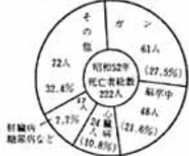
52年の市民死因別死亡数