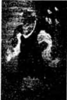
庚申さまの掛け物

この人達は、今でも「庚申さま」と呼び、田圃でいう「庚申の日」に講の座をもうけて、座元に集まり、「庚申さま」祭りが盛大に継承されています。