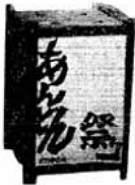
市民まつりのシンボル・あんどん

工事は、外壁、内壁、天井などについて行い、防音サッシ、冷暖房機換気扇を取り付けます。基準額以内の費用であれば個人負担はありませぬ。 申し込み用紙と第1種区域図は市衛生課にあります。なお不明の点は福岡空港周辺整備機構(472)4594、または市衛生課(501)1131にお問い合わせください。