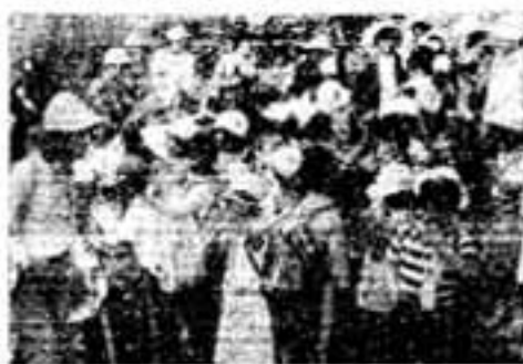
須玖小学校と春日北小学校の留守家庭児童（1年から3