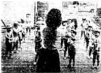
◇乾布まさつでヨイショヨイショ◇ 春日東体育所は朝9時半から30分間児童全員がはだかで乾布まさつを続けています。寒い冬の日も休まずヨイショヨイショ。お盆でカゼともさよならです。