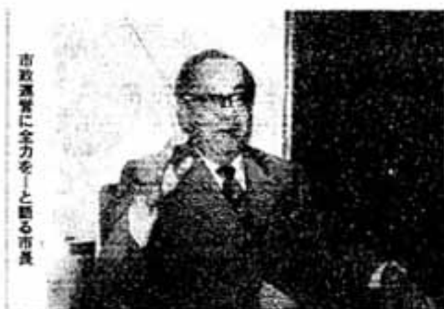
市政運営に全力を——と語る市長

市長選挙にあたって、市民のみなさんに無投票で選んで頂いたことに深く感謝しております。 それだけに、市民のみなさんには、より大きな責任を感じ、これからの2期目の市政運営には私の全力を注ぐ決意を固めています。