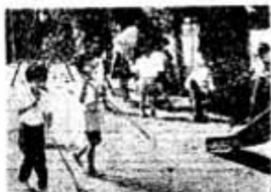
遊び場をきれいに わたしたちの遊び場をいつもきれいに一松葉ほうきを手に児童たちの清掃作業。「ここにもゴミが」と2歳児もお掃除がしたそう。一昇町保育所で