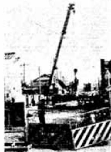
進む下水道工事（大和町）

また、既存緑地の松蛾虫の駆除を昨年に引き続き実施するとともに白水池周辺の緑地保全林地区をさらに指定し、緑地保全の確保に努力いたします。