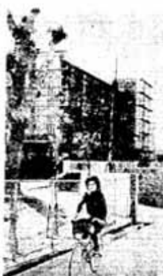
春日西中学校の増築工事

社会福祉センターが福祉活動の拠点として、また広く市民の福祉に貢献できるよう、関係機関とも連携を密にして充実していきたいと考えています。