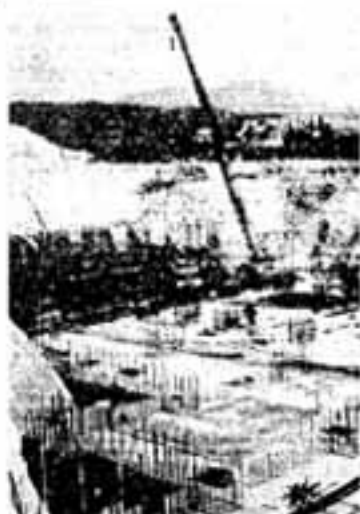
大ビルが3つはスッポリはいる南 部清掃工場の地下工事

本体工事は昭和55年9月竣工、直ちに試運転に入り、56年4月には操業開始の予定になっており、工場完成後は清掃行政の拠点として本市の清掃行政に大きく寄与するものと期待しております。