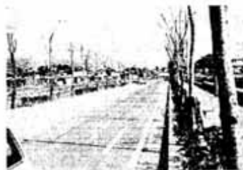
完成した現人橋～乙金線の一部(松ヶ丘)

高校への通学路としても重要であり、御供田区園整理事業進行の牛頸川3号橋建設と併せて地区外取り付け道路原町～御供田線の延長100メートルを改良し、安全円滑な道路交通を確保します。