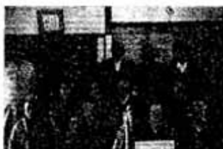
優勝杯を贈んだ桜ヶ丘チーム