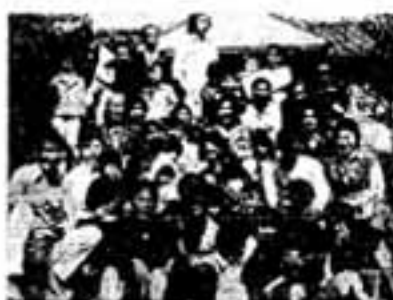
ベトナム難民と記念撮影(収容所前で)

これは少年たちが市民に呼びかけ、各家庭から集めた衣服、履物、電気製品などで、今回が三度目の慰問。言葉こそ通じなかったが、子ども同士が、歌やゲームを楽しみました。