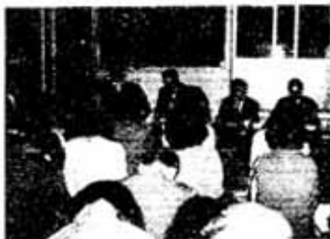
写真：下白水地区の勉強会(春日市婦人団体連絡協議会)

も育成会・PTA等と連携し、警察・保護司・青少年補導員・中学校生活指導の先生等を招いて勉強会を開き、非行の実態を知り、今後、家庭の中で、また地域の母親として何をなすべきか等話し合いました。今後、実践活動へ展開する必要性を痛感し具体策が専門家でねられて