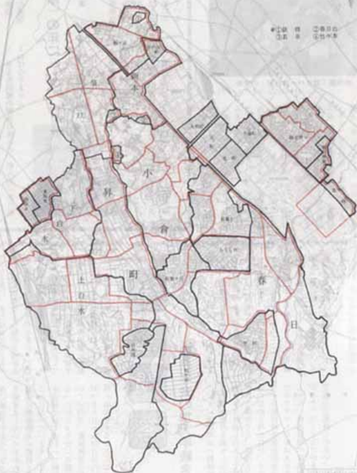
行政区域再編成図(案)