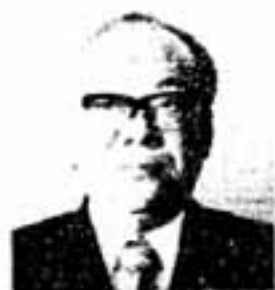
市長 滝谷 長栄