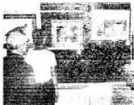
第4回千歳町文化祭会場から

ラウンドで実を結びました。昨年は千歳町の体育館だけで40万円の経費がかかったのに、一地区10万円の費用で、今年にはぎやかな体育大会実現に成功しました。10月10日から3日間、新公民館で開かれた千歳町恒例の第4回文化祭の会場でも「前例までは会場が狭くて展示するのに苦労しましたが、こしはもっと出品が欲しいくらい。来年は3地区に出品を呼びか