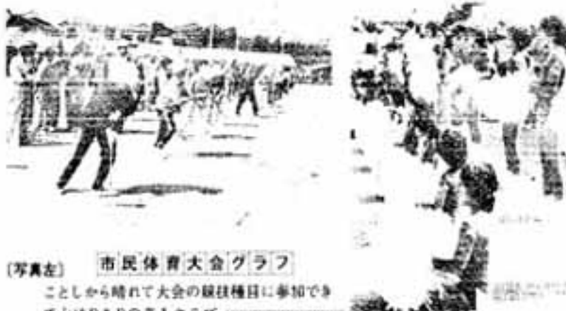
市民体育大会グラフ

申し込みは、市立市民スポーツセンター体育館内、社会体育課。使用月の1ヶ月前の1日から受け付けています。受け付け時間は毎日9時から15時まで。 詳しいことは社会体育課(21) 3234にお問い合わせください。