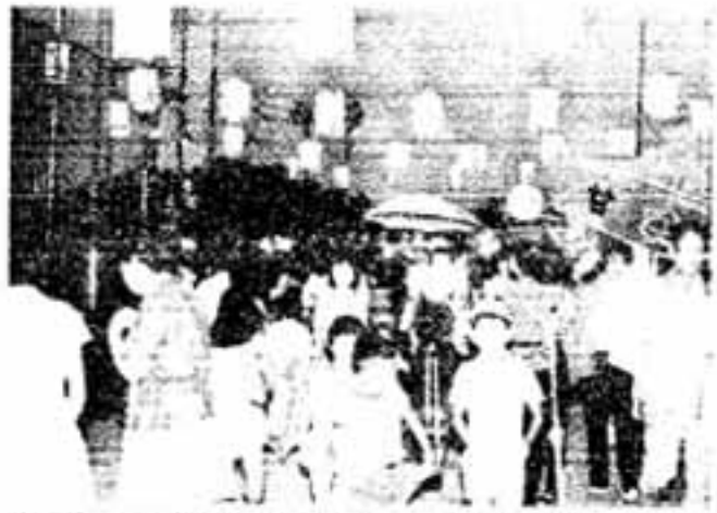
あんどんの下に雨がさのトンネルも一時出現しましたが