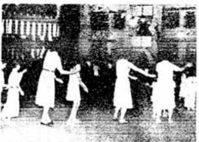
地区祭りの全会場で展開された歌と踊りの風景—若草地区—