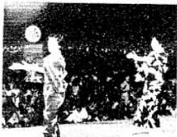
ふるさと芸能は25地区が力こぶ入れての出演