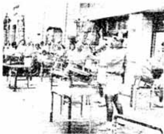
春日一番太鼓は市内数カ所でも抽ろう

雨空をにらみながら8月16・17日行われた第4回春日あんどん祭りは3万近い市民の参加を得て盛況のうちに終わりました。