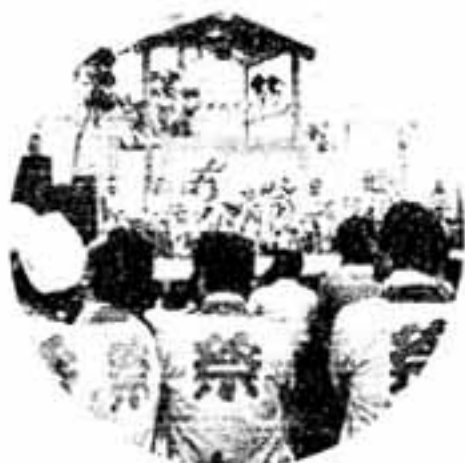
ふるさと芸能がはじまると人の輪も次第に広がっていく