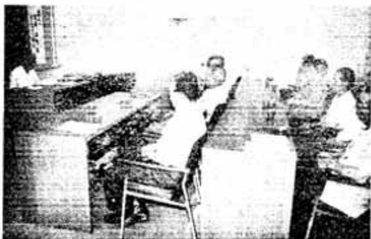
【老人福祉大学講座】 講座の目標を「福祉」の意 義と価値を理解させ、春日の 歴史を学んで郷土への愛着を 高める一とところにおき、福祉 学、説明をさくみなさん。