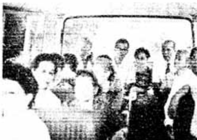
バスで市内の遺跡見学をする老人福祉大学生

ますので、「大学生」のおじいさん、おばあさんたちは心身両面とも健やかなおとしよりのなかの「エリートたち」です。一方、老人福祉大学の方は、市内を5地区に分けて、車で通学の送り迎えをするサービスぶりなので、特に人気があるようです。