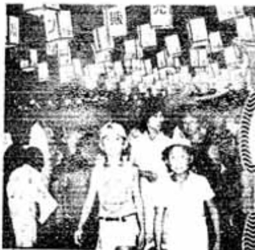
なつかしい「あんどんのトンネル」