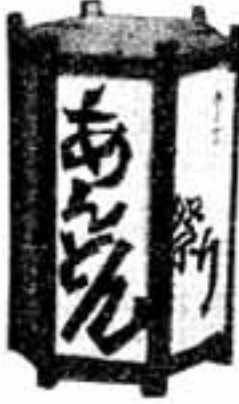
あんどん祭り中央会場案内図

私たちの住む春日市は、昔から豊かな緑の木立や森に囲まれ、きれいな水をたたえた数多くの池に恵まれた静かな里でした。 ところが、近年のはげしい都市化とその開発の波は私たちの春日のまちにも押し寄せて、古代文化の誇り高い遺跡や史跡を洗い、古人の安らかな眠りも妨げられようとしています。 そこで、その霊を慰め、古人とふるさとをしのぼうと、併せて、私たち市民みんなのまつりに盛り上げ、お互いに、心のかべをとり去って、市民みんなの「ふれあい」の場に、また市民の心に深く刻まれる祭りに育てたいとの願いをこめて、昭和52年秋、市制5周年記念行事の一つとして始められました。 （市民まつり実行委員会） それとともに、古人の暮らしの光りでもあった行灯（あんどん）をもとして こんな目的ではじめました