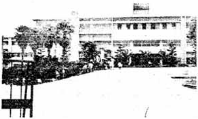
(写真せつめい) ①棟に生まれ、丘の上にとっしり建っている現校舎 ②30周年記念事業・「屋外学習園」の施設をつくる児童たち