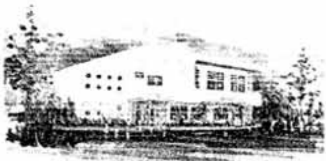
児童センターの完成予想図

2千平方メートルの用地に延べ250平方メートルの鉄筋コンクリート2階建てのセンターを建設、来年度6月には開館の予定です。