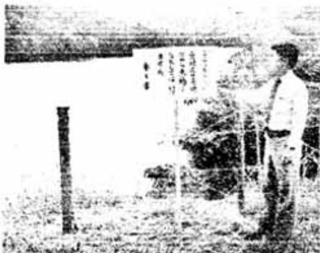
「ここは危険です」(白水池周辺にたてられた標札)

このような水の事故の約7割が、保護者（同伴者）がそばにいないときに起きています。