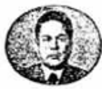
白水市民まつり 実行委員会会長

あんどん祭りは、ことしで第4回を迎えます。 初日に地区祭り、2日目に中本祭りを催す行事の本筋は昨年同様です。