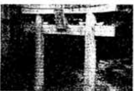
三郎天神の境内と鳥居

春日神社を中心に、「上原屋敷」 と「下原屋敷」の二つに区分され る旧春日に、春日神社の本社がそ れぞれ、つつつあります。上の方 は「三郎天神」、下の方は「地蔵 天神」と呼んでいます。 さて、三郎天神ですが、上原屋 敷の中心部に位置し、境内は約60