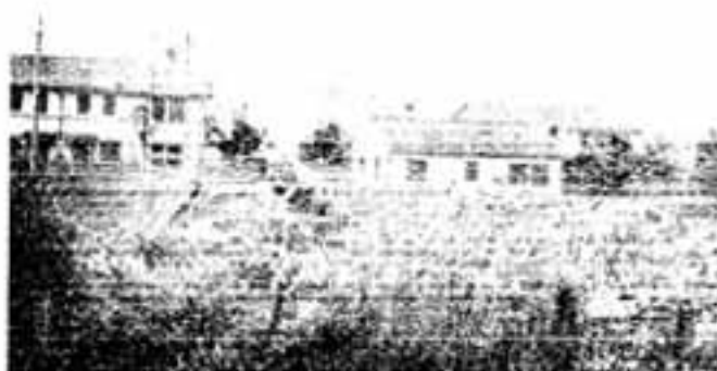
九大用地の整地工事が進む(左の向うは春日高校)

四つの機関は、理工学の研究と教育の推進を図る学際大学院・総合理工学研究科、核融合の基礎研