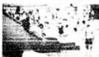
市民プールのにぎわい