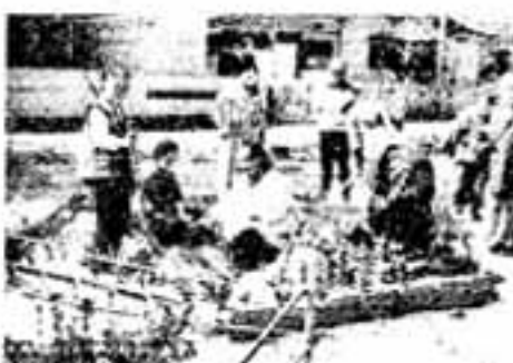
皆さんの積極的な参加をお願いします。

6月の献血のお知らせ 市献血推進協議会では、献血を次のとおり実施します。市民のみ