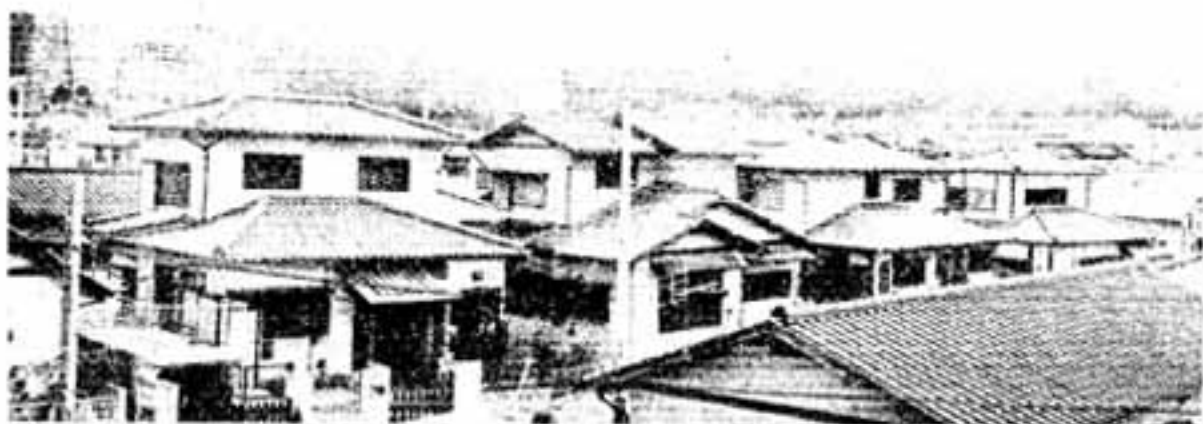
㊦㊧—福岡市南部清掃工場の建設工事・街並を右に抜けると白水大池公園へ