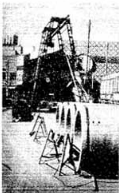
春日原商店街にのびた汚水幹線工事（西武駅付近で）

桜ヶ丘地区のほとんど日の出町地区の一部で供用を開始した市の下水道事業は、春日原地区でも下水道幹線に着手、ピッチを上げています。 ○56年度は春日原地区から春日公園へと汚水幹線全長600メートルを延ばすとともに、56年度には枝線工事も並行して進め、春日原地区でも一部で供用を開始する予定でいます。 ○一方、諸國川を生かした雨水幹線工事は、小倉第一・昇町第一両幹線工事を進め、早期完成を目指しています。