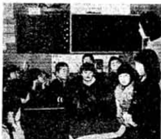
留守家庭の子どもたち

在宅福祉サービスの一環として、市社会福祉協議会は移動入浴車を本年度から巡回させます。 4月一ばい試運転し、5月から定期的に巡回入浴サービスを始めますので、ねたきり老人や障害者で入浴が困難な人たちは、うれしい車での訪問になります。