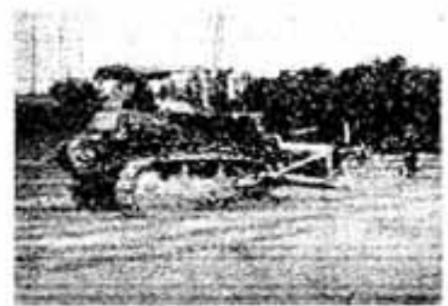
第9小学校は8月に着工

来年4月から天神山配水塔西側に開校される第9小学校（仮称）の建設工事は、校地2万7千平方メートルの造成作業が除上自衛隊春日作業隊の協力で進み、製作業関係の整地は2月末で完了しました。 校舎の建設は8月には着手し、鉄筋コンクリート3階建て（延べ4256平方メートル）の普通教室棟（普通教室18特別教室7）および管理棟が来年2月には完工します。