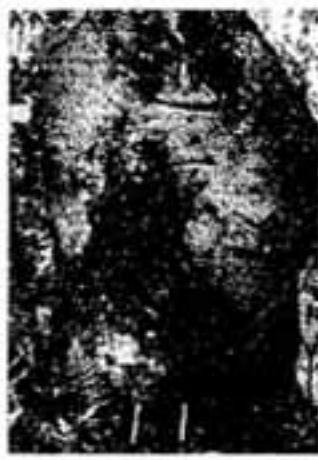
藤前坊の墓(藤の原)

下白水一の谷に、寺田池という大池があります。土地の人は大池田池と呼んでいますが、この池の堤防の西の方に、かなり広い、こんもりした森があります。この辺りに、むかし蓮華寺という神宮の寺があったという伝説があります。