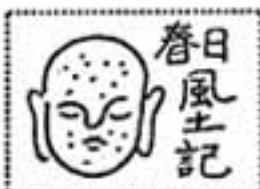
春日の社誌 春日神社(その五)

豊前中津は方石を運荷していた黒田孝高(如水)・長政父子は、関ヶ原の戦いで徳川軍に加勢し、その歳功として、武蔵野り余石の浦主となり、寛永5年11月に、小