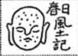
春日の社① 春日神社 (その四)

天正の頃、高橋信連が前を領す「大友資料」にありますので、この春日の地も固有していたのではないのでしょうか。そのために、島津軍から攻められ、前導のよう