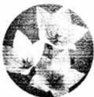
よく「宿根草」「一シエツコソウ」という言葉を耳にします。

（宿根草）とは、草花の根や茎の一部が越冬し、長年におたり、開花し、あるいは実を結んだりして、これを繰り返しながら生育をつづけるものを宿根草、または多年草と呼んでいますが、長く生きつづけるといっても、古い部分は枯死して、新しい茎葉と根が引き継いで生活します。代表的なものをあげます。