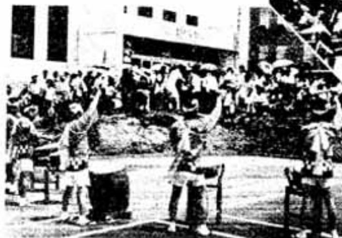
春日太鼓のバチ音も高く