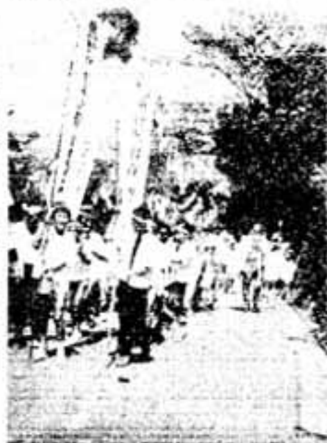
交通安全「学業成就」折って

岡本鎮野神社の夏祭り「どんか ん祭り」が8月5日午前10時からに ぎやかに行われました。 昔の虫遣いまつりを子供会の七 少まつりと一緒にし、どんかん祭 岡本の(どん)かん祭り りとして復活して3年目。新調の ハッピ・はちまき姿の子供会員 人に地区の役員、幹部たちも加わ り、「学業成就」「交通安全」のの ぼりを立て、みこしを引いて地区 内の各町内を回りました。