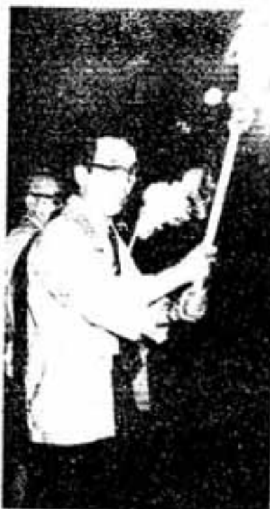
燃えさかる「春日の火」が到着