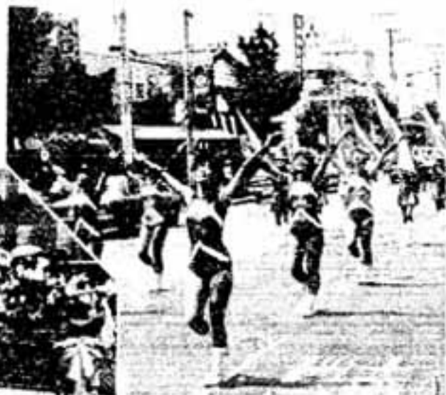
9パントアラールが演出する「躍動美」

「春日の火」を迎え、祭りはクライマックスへ、白水市民まつり振興会長の開会あいさつ。