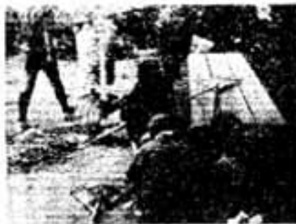
清掃奉仕活動をする第1団カブ隊

変更の場合がありますので事前に春日大野消防署(571-1191)か春日市役所(501-1131)へお問い合わせください。保険証を必ずご持参ください。