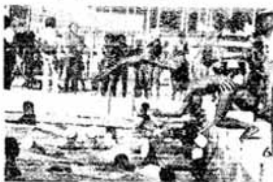
プールの開場時間

低学年児童と幼児は必ず大人や成人者に同伴してもらってください。47年開場以来の事故「0」を今年も続けましょう。