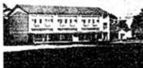
当時の春日原分校（35年8月）

春日原小学校は創立20周年記念日を4月6日に迎えましたが入、進学シーズン中をきけて、5月16