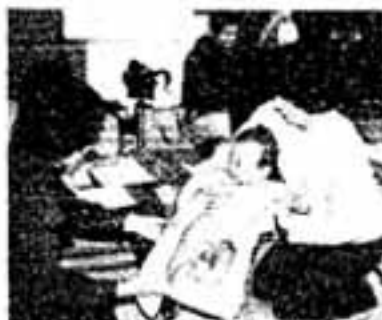
にぎわう乳幼児の健康相談

市民みなさんが、健康で毎日を送られるようにと市は毎月第一月曜日(10時～13時)に健康相談の日を、また第4水曜日(1～3時)に乳幼児と母の健康相談を開いています。お気軽にどうぞ。