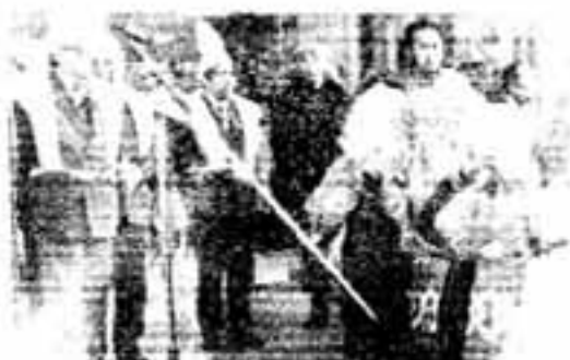
スーパードラッグの出陣式

北京・瀋陽「友好の翼」受付 筑紫地区各界友好訪中派遣委員会が計画している「福岡ー北京」間空路往復の「友好の翼」のコースが決まり、参加者の受け付けを始めた。 【Aコース】 旅費34万7千円 ・福岡または長崎発ー北京ー長春ー沈陽ー北京ー福岡着(長崎) 【Bコース】 旅費31万Aと同じ ・福岡または長崎発ー北京ー大連ー沈陽ー北京ー福岡着(長崎)