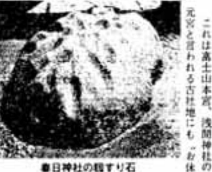
春日神社の観すり石

なぜ、この石に注連縄が張られ るのでしょうか。 宮座記録によると、注連縄を張 るのは全部で10ヶ所となっていて、 塔玉石と呼ばれているこの石も含 まれています。かつて神幸祭が華 やかに行われていた頃、御輿(み こし)を一時この石の上に預けた (ひと休みする)と言い伝えられ ています。