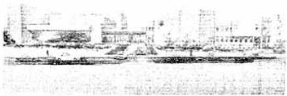
市立文化会館の完成予想図 ㊸文化ホール㊹コミュニティセンター

東春、市制施行10周年を迎える市は、市民待望の文化会館の建設に着手することになり、建設計画ならびに建設費などを含む56年度予算案を3月の定例市議会に提出します。