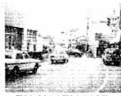
町らしくなった下白水の中心街

設置にも力を入れました。既設の基にり基を新設、全部を明るく電光灯に取り替えていくと張り切っています。