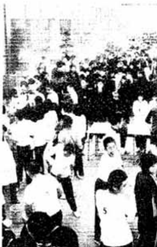
全校 1,000人が参加して (西中校庭で)

春日西中学校恒例のもちつきが 旧暦1月23日、全校生徒975人 に山田校長はじめ職員、応援の父 兄も参加して、両校校庭で盛大に 行われました。 このもちつきは同校開校以来の 全校行事で、昨年3年生が苗から 育て収穫した3俵のモチ米を、校 庭にズラリうすを並べて正午から 威勢よくつきはじめました。 つき上げたモチは女子生徒やお 母さん方の手で丸められて各教室 に運ばれ茶話会の華子代りに。 この日、午前中ワラソン大会や 学級対抗駅伝が行われて、生徒た ちはお腹をすかしていただけに、 おいしそうに平げました。 なお、おもちは例年のように、 栄光園やひとり暮らしの老人給食 用に贈られて、「福祉もち」になり ました。