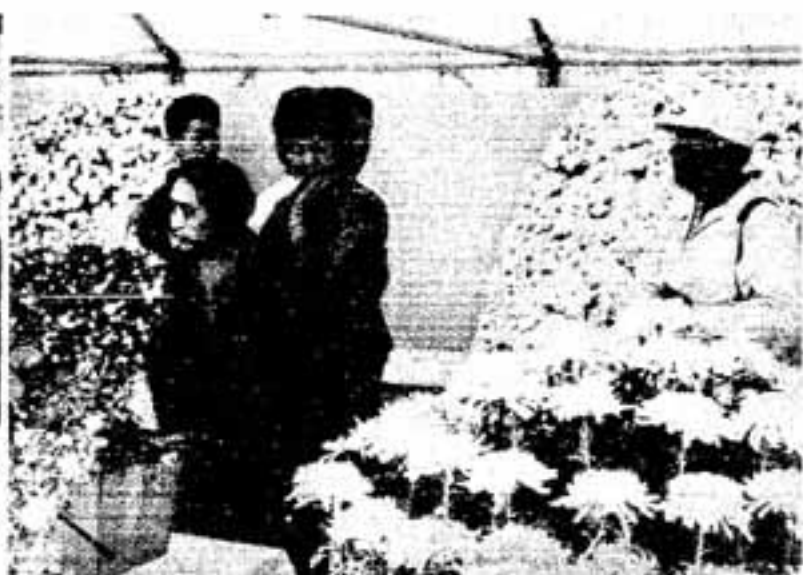
〔写真〕◎◎障害者コーナーも 新設されて◎社会教育学習展 ◎◎手芸展◎人気もの菊花展