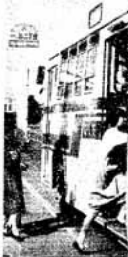
一の谷2丁目バス停で

惣利南口から大土駅・昇町経由西鉄大橋駅に通じるバス路線「春日・大橋線」が11月1日から開通しました。大野城市の平野ハイツ・大橋駅前1日3往復で、大土駅・市役所前には昇町公民館前、一の谷1、2丁目の3停留所が新設され、大橋駅では福岡発急行電 車に接続しています。また、登天神・博多線バスの大和町経由の運行回数が増え、室町に停留所が新設されたほか、これまで1ヶ所しか止まらなかった昇町では市役所前、派出所前の2ヶ所で停車するなど、市民の足の便宜が図られています。