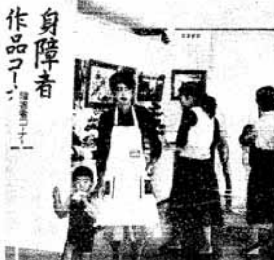
身障者 作品コーナー