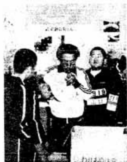
郷土史研究会のコーナーでは集まった子どもたちに竹笛の作り方も指導