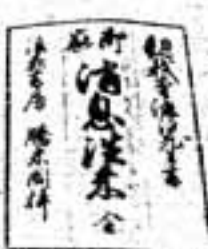
須玖小創設地の決め手となる鍵

「この「旧民家」と「僧宅」にあると思われる。「旧民家」借宅」は実は寺子屋だったのです。